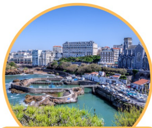
Septembre 2026 Voyage ANCV à Seignosse