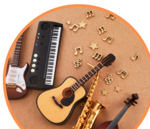
Mercredi 17 Juin 2026 Fête d'été de l'association