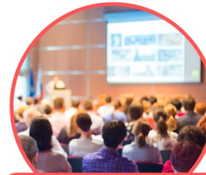
Mercredi 25 Novembre 2026 Assemblée générale de l'OPAR