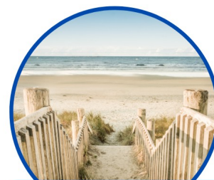
Juillet 2026 Séjour surprise