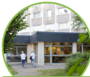
Jeudi 10 Septembre 2026 Portes ouvertes de l'association